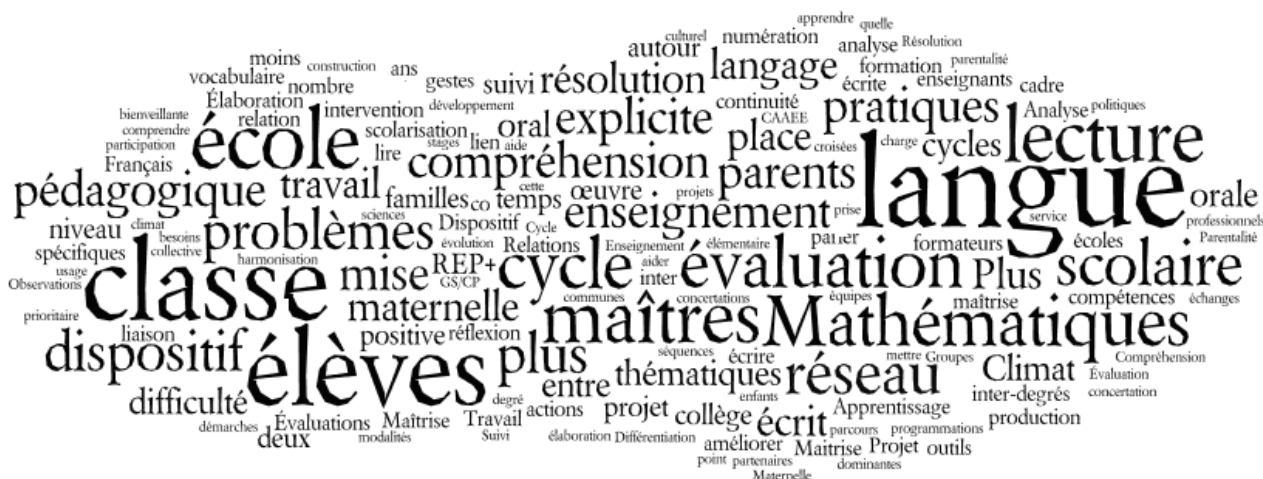
Illustration de la fréquence des mots utilisés dans les réponses des réseaux pour expliciter les thématiques travaillées (plus le mot apparaît en gros, plus il est apparu fréquemment)

Les thématiques de ces temps collectifs sont très centrées sur les apprentissages et des problématiques pédagogiques : la langue (la maîtrise du français dans les DOM) et plus spécifiquement la compréhension en lecture , l'enseignement des mathématiques , la mise en place des dispositifs plus de maîtres que de classe et scolarisation des moins de trois ans, l'enseignement explicite , les évaluations diagnostiques.